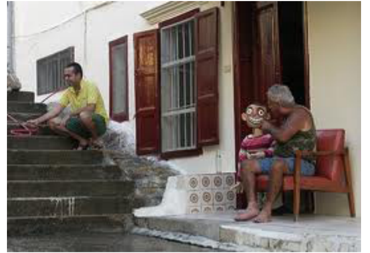
Un spectacle qui implique activement les résidents et le publique

Plus que jamais, le Collectif Kahraba affirme à travers cet événement qu'il est important de nous rassembler et de vivre ensemble des instants de beauté, et que l'art et la culture sont vecteurs de paix.